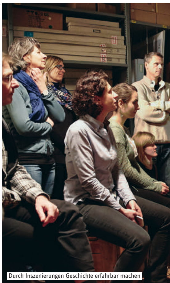
Durch Inszenierungen Geschichte erfahrbar machen

scher Wissenschaft und/oder Geschichtsdidaktik an einer anerkannten Hochschule nachweisen können. Die Studierenden können dieses sogenannte «Ergänzungsprogramm bis 60 ECTS-Punkte» parallel zu ihrem Masterstudium absolvieren.