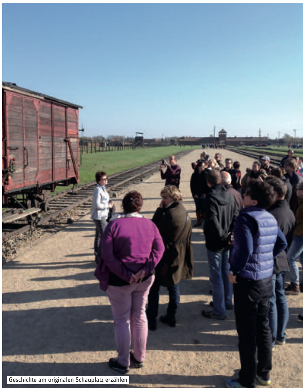
Geschichte am originalen Schauplatz erzählen